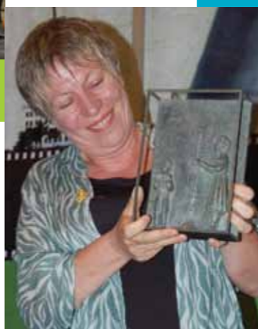
María Teresa Andruetto 2009